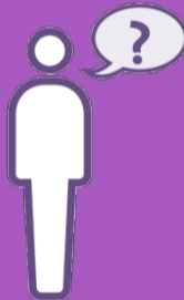
Hol dir Hilfe