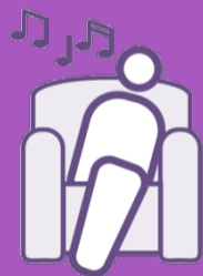
Entspanne dich bewusst