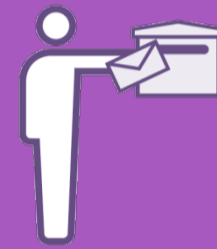
Halte Kontakt mit Freunden